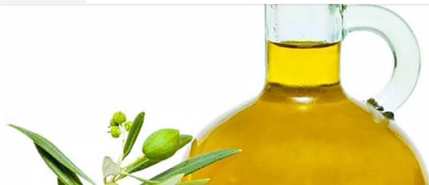
Olivos: a mal tiempo, buena cara